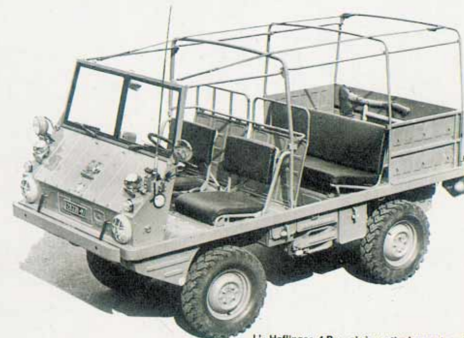
L' Haflinger 4 R -: cioè particolarmente adatto e attrezzato per il fuori strada turistico. Per la sua descrizione rimandiamo al fascicolo di giugno 1966 di « Quattroruote ».